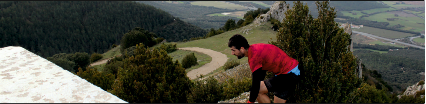
Descripción de la ruta / Ibilbidearen deskribapena