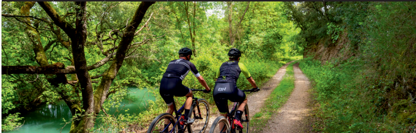
Descripción de la ruta / Ibilbidearen deskribapena