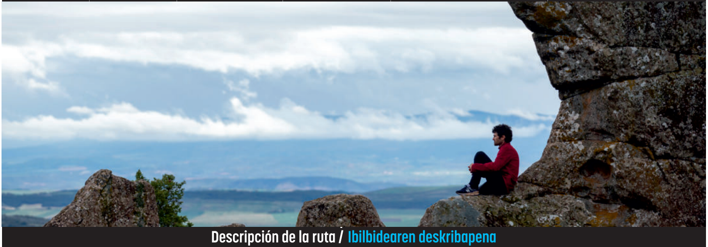
Descripción de la ruta / Ibilbidearen deskribapena