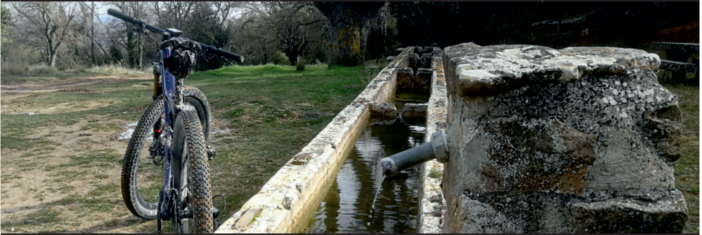
Descripción de la ruta / Ibilbidearen deskribapena