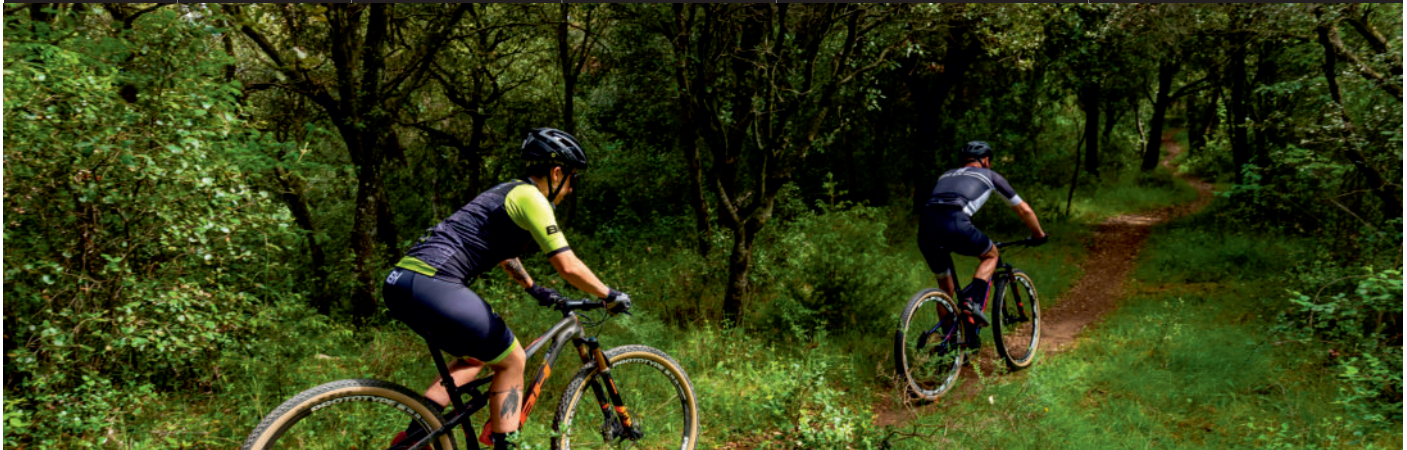
Descripción de la ruta / Ibilbidearen deskribapena