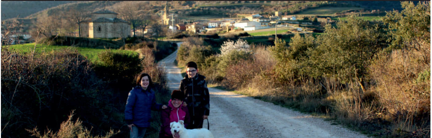
Descripción de la ruta / Ibilbidearen deskribapena